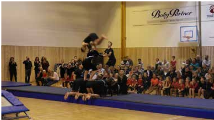
Dei eldste turnarane med ei spektakulær avslutning.

Eg vil til slutt nytte høve til å takka alle utøvarar og foreldre som bidreg til eit posetivt og inkluderande turnmiljø. Takk for den gode innsatsen dokker trenarar legg ned kvar veke for våre barn.