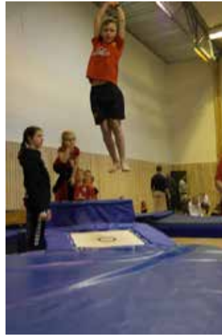
7-9 åringane med høge strake svev.